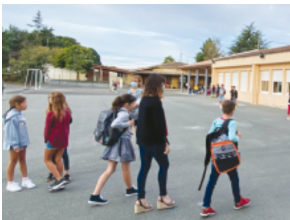
L'heure de la rentrée a sonné !