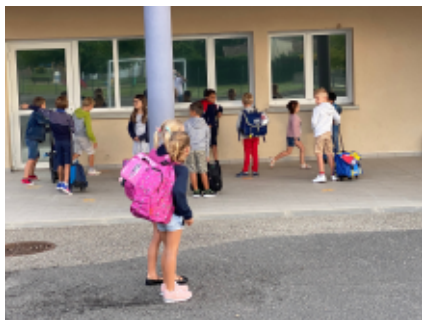
Vive la rentrée !