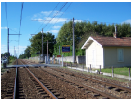
La gare d'Arbanats