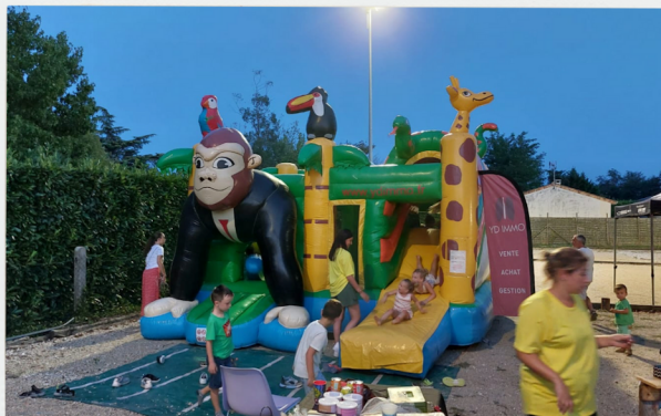
Le coin des enfants