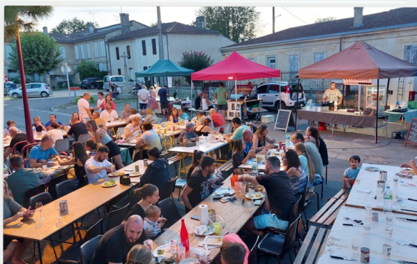
Début de soirée