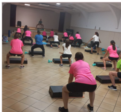
Cours de step