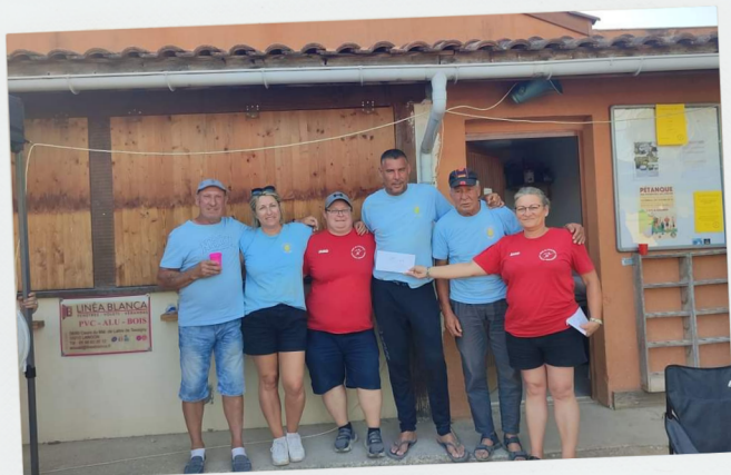
12 heures d'Arbanats