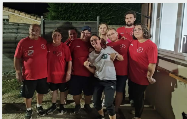
Concours du 30 septembre